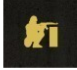
Strzał zza osłony